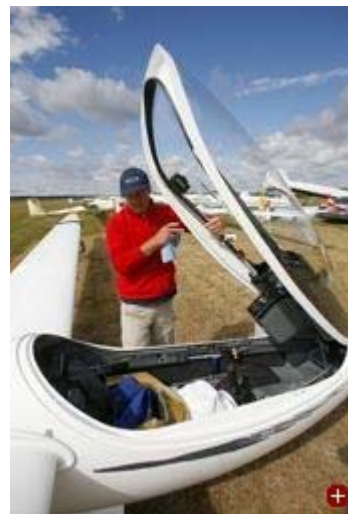
Ein französischer WM-Teilnehmer trocknet sein Fluggerät ab