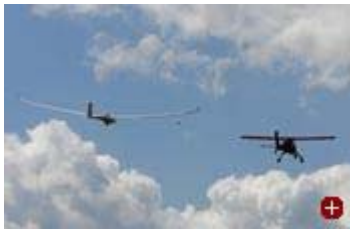
Auf geht's: Ein Schleppflugzeug bringt einen Segelflieger in die Luft

07. August 2008 Vorsicht Wildwechsel - als Autofahrer sind einem die warnenden Schilder mit dem springenden Rotwild vertraut - hier heißt es immer: langsam machen, vom Gas gehen. Zusammenstöße der tierischen Art passieren auf deutschen Straßen leider viel zu häufig. Und oft ist der Schaden groß.