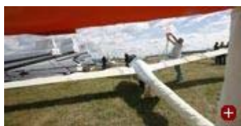
Wasser statt Benzin: Ein Techniker füllt Ballastflüssigkeit in den Tank